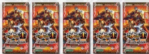
未開封のブースターパック5パック(例)