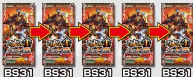
BS31 BS31 BS31 BS31 BS31