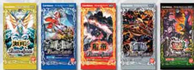
未開封のブースターパック5パック(例)